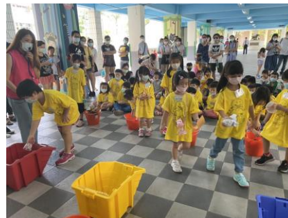
新生參與宣導活動情形