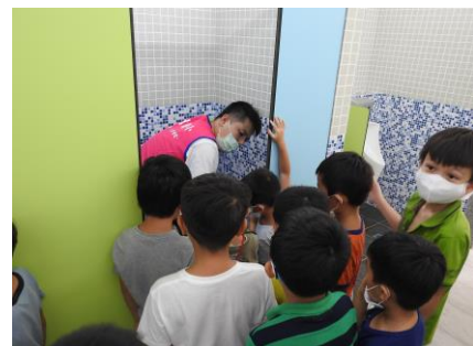
依大小號，使用不同水量