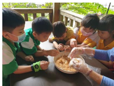
二年級-老頭擺農莊