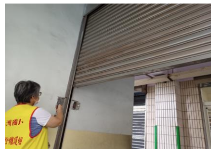
防火鐵捲門、防火門區劃確認