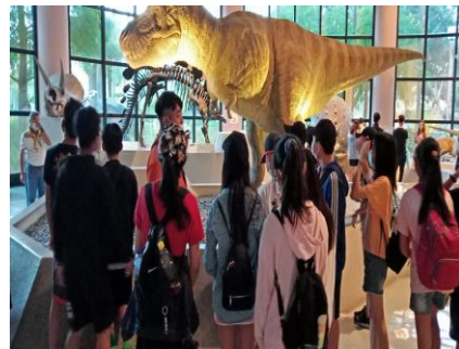
六年級-國立自然科學博物館