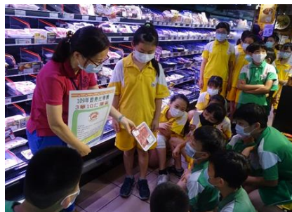
農產品三章一Q標章教學