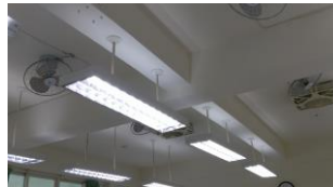
全面換成 LED 燈具