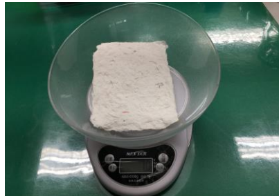
回收再製成再生紙