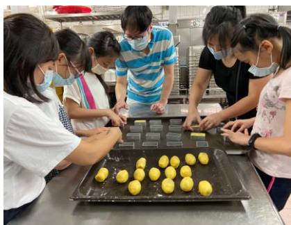
親子米鳳梨酥製作