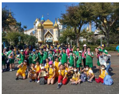
五年級-六福村主題遊樂園