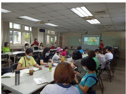
宣導火災警報器的重要