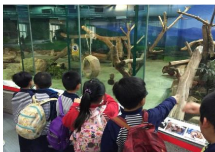
一年級-木柵動物園