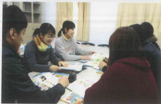
說明 3: 家庭教育課程研討