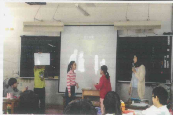
說明 7: 五年級專輔教師入班授課