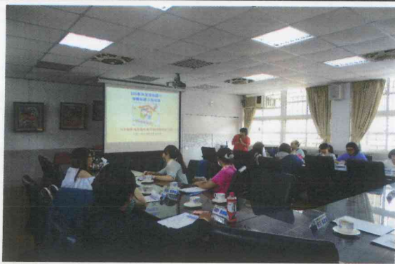
說明 1: 辦理公開授課-集體說課