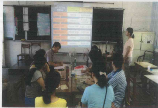
說明 4: 介紹家庭教育課程