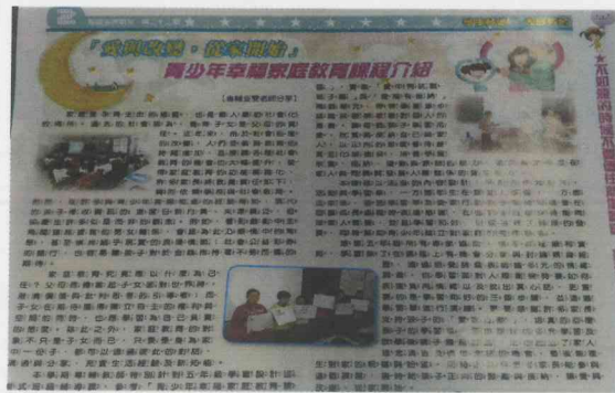
說明 6: 利用輔導刊物介紹課程