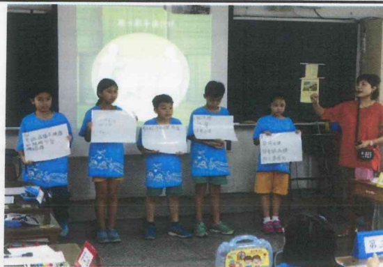
說明 2: 辦理公開授課-五年級授課