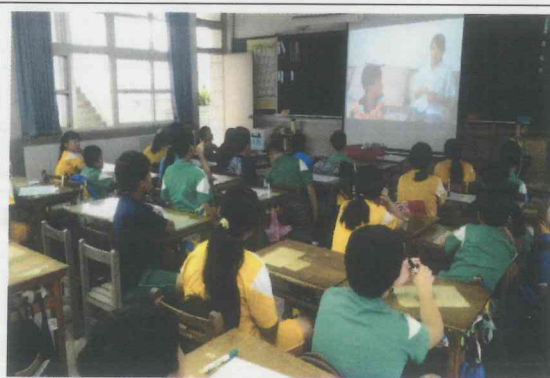
說明 8: 六年級專輔教師入班授課