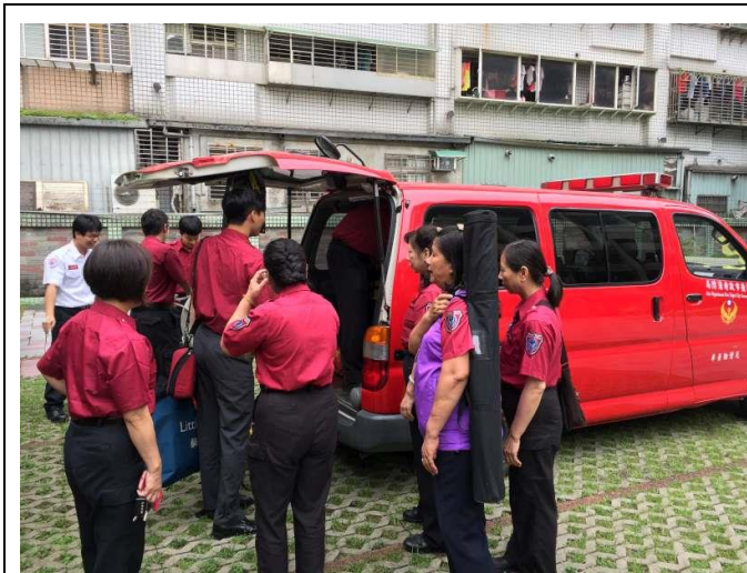
說明：邀請溪崑消防隊到校宣導 地點：本校操場