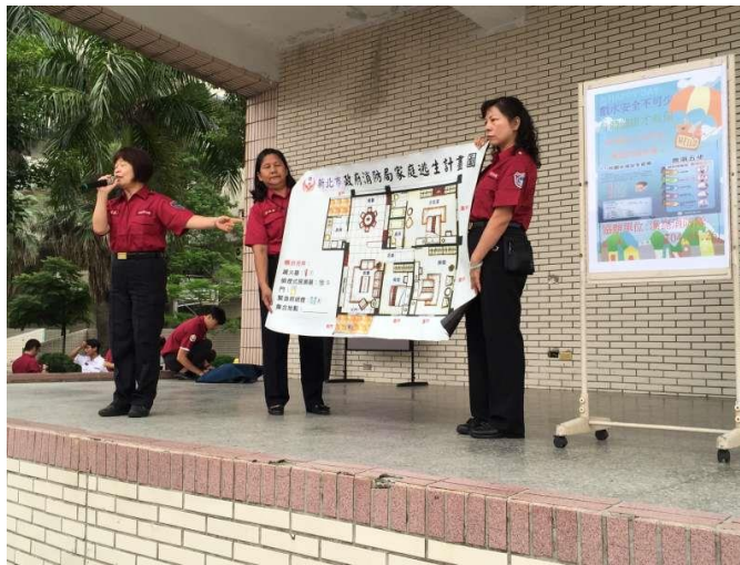
說明：結合居家逃生路線圖宣導 地點：本校操場